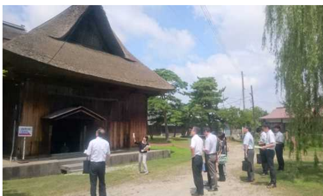
【昨年度までの様子】