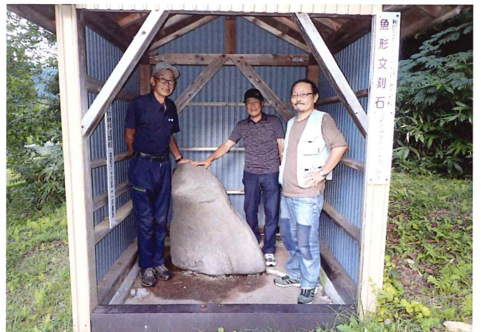
阿仁根子の魚形文刻石