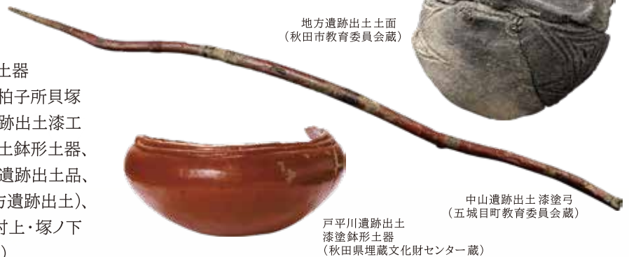
地方遺跡出土土面 (秋田市教育委員会蔵)

【県指定有形文化財】山館上ノ山遺跡出土鋒形石器、柏子所貝塚出土骨角製品及び貝製品、魚形文刻石(拓本)、中山遺跡出土漆工及び漆工関係出土品、戸平川遺跡出土品、沢田遺跡出土鉢形土器、根子ノ沢遺跡出土土器、大湯環状列石出土品、伊勢堂岱遺跡出土品、白坂遺跡出土品、麻生遺跡出土品、土面(戸平川・地方遺跡出土)、土偶(黒倉Ⅰ遺跡・中杉沢A遺跡・坂ノ上F遺跡・東福寺村上・塚ノ下遺跡・大曲館ノ下・虫内Ⅰ遺跡・星宮遺跡・鏡田遺跡出土)